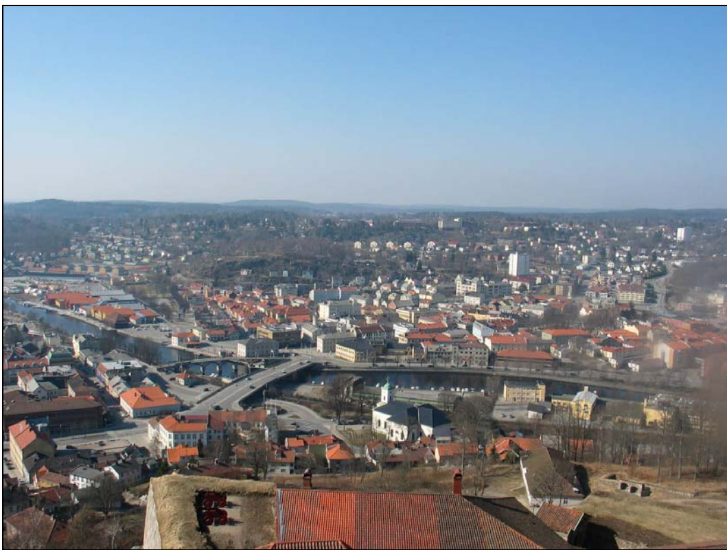
Halden i Østfold, 3. april.

Månedstemperaturen for april var godt over normalen i hele landet. Størst temperaturavvik fikk indre deler av Troms, der månedstemperaturen var opp til 3,2 grader over normalen. Det var store nedbørforskjeller mellom landsdelene. Månedsnedbøren i deler av Finnmark, Hordaland og Sogn og Fjordane var to til tre ganger større enn normalen, mens enkelte deler av Oppland og Hedmark bare fikk 20-40 % av normalen.